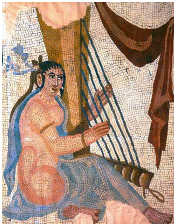
نمونه ی هنر دوران ساسانی. موزاییکی از ریزه های سنگ

ه.ق) در کتاب ۱۸ جلدی تاریخ الرسل و الملوك يا تاريخ الامم والملوك معروف به تاريخ طبري، شويس عدوي، محمد بن جرير طبري ( ۲۲۴ ه.ق در آمل - ۳۱۰ ه.ق ) در کتاب ۱۸ جلدی تاريخ الرسل و الملوك يا تاريخ الامم والملوك معروف به تاريخ طبري و ... مدد می گیریم!