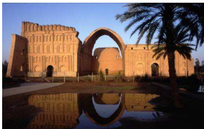
خرابه های تاق کسری در عراق کنونی

چرا توده ها نباید بدانند و آگاه شوند که: آنان که آمدند خالد بن ولیده‌ها، سعد وقاص ها و شمشیرداران بیابانی شان بودند، که به نام آیین خدا و احکام قرآن آمدند تا تا تازیان را سروری و عزت بخشند و هستی و ناموس شان را بتاراج برند؟