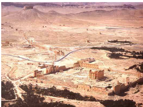
آثار بر جای مانده از شهر تدمر در قلب صحرا

دست کاهنان بود و دوم از اواسط قرن ششم ق. م . تا انقراض که سلاطین مقتدر و غیر دینی و مذهبی به قدرت رسیدند. در دوره اول، پایتخت آنها شهر صرواح بوده است . در سال ۱۱۵ ق.م . قوم حمیر که باز از مناطق جنوبی شبه جزیره بودند ابتدا بر ممالک قتیانی و بعد بر سبا تسلط یافتند. در قرن دوم مسیحی حبشی ها ( شمال افریقا ) بر ممالک تحت نفوذ حمیریها استیلا یافتند و پای مبلغین و مروجین مسیحیت را به شبه جزیره و به ویژه منطقه یمن باز کردند و کلیساهای مسیحی را بر پای نمودند! ( داستان حمله ی ابرهه به مکه و شکست وی توسط خدای کعبه از همین جا نشأت می گیرد! ) حمیریها که از تسلط حبشی های مسیحی و بیگانه بر خاک خود ناخشنود و ناخرسند بودند، سر انجام به دربار ساسانیان روی آوردند و از خسرو انوشروان استمداد طلبیدند! دولت ایران در حدود سال ۵۷۰ م . به یمن لشکرکشی کرد و حبشی ها را شکست داد و خود بر یمن فرمانروا شد!