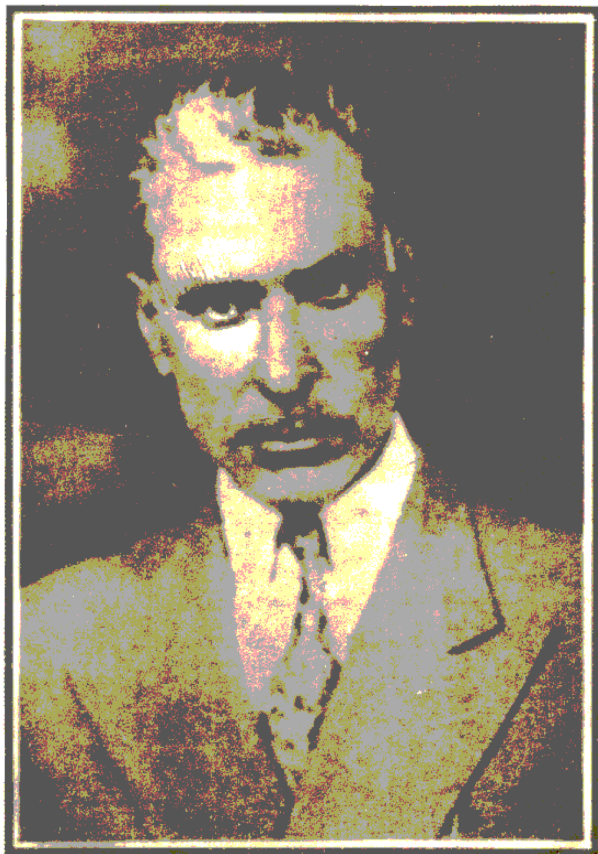
میر غلام محمد غبار (آخرین تصویر مؤلف)