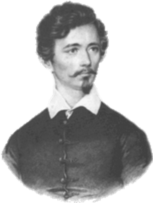
شاندور پتوفی مجارستانی انقلابی شاعر