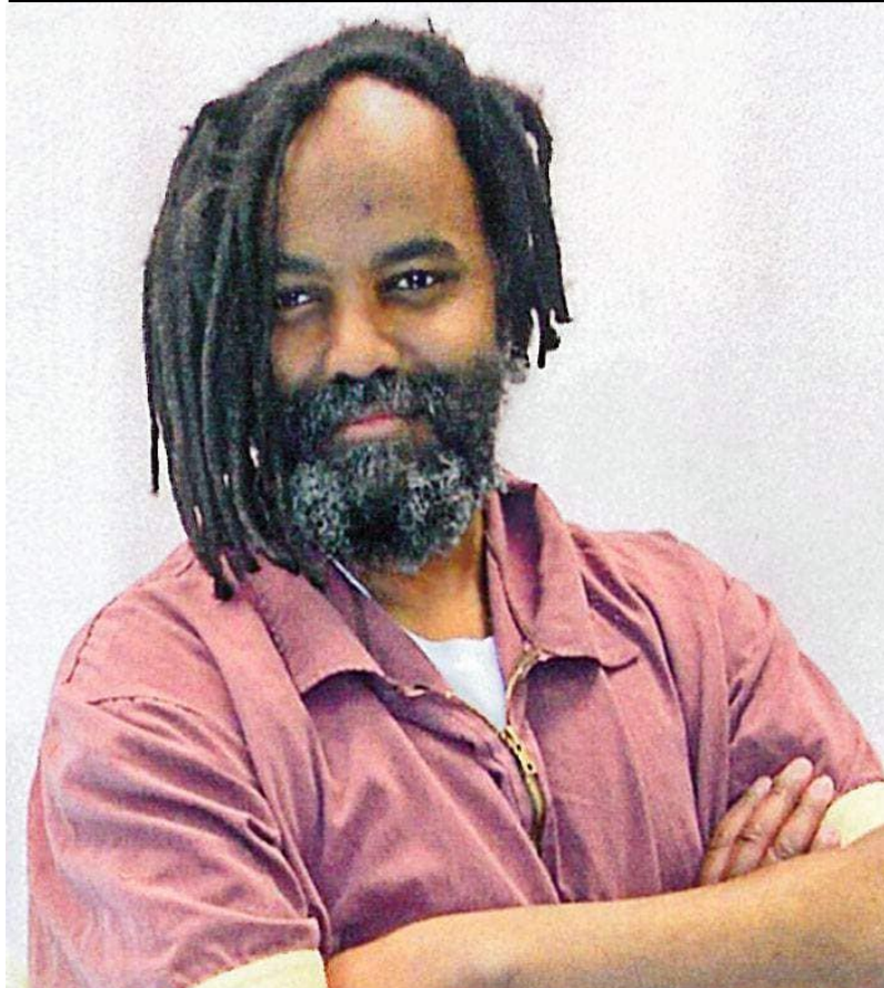
مومیا ابوجمال (امریکایی)، د ۱۹۹۴ کال دسمبر

بگذریم از اینکه سطح کارگران بیکار بیش از پیش افزایش یافته است و این خود سطح استثمار طبقه کارگر را بالا برده است. در حال حاضر کارگران کشور ما، ارزان ترین نیروی کار در کشورهای منطقه به شمار می رود.